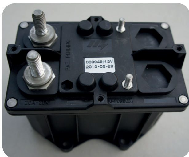
Exempel på elmanövrerad huvudströmbrytare.

All montering av elmanövrerade huvudströmbrytare ska göras av märkesverkstad/fackman.